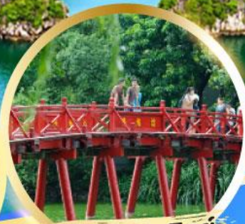
สะพานแสงอาทิตย์