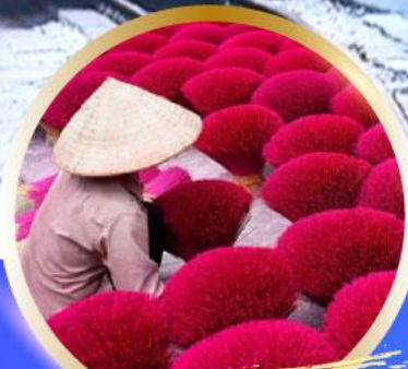
หมู่บ้านรูป Phu Cau