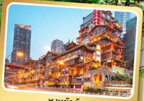
หงหย่าตัง