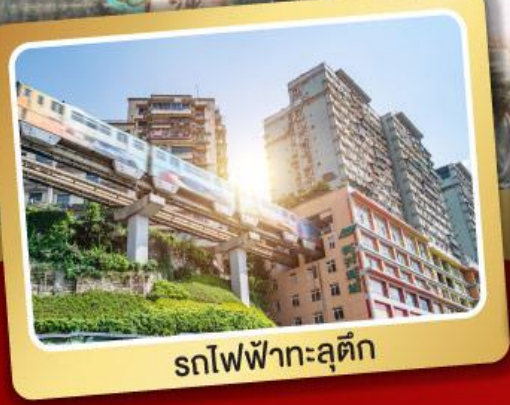
รถไฟฟ้ากะลุดี้ก