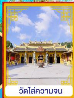
วัดไล่ความจน