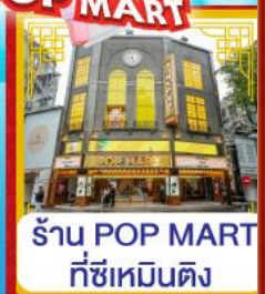
ร้าน POP MART ที่ซีเหมินติง