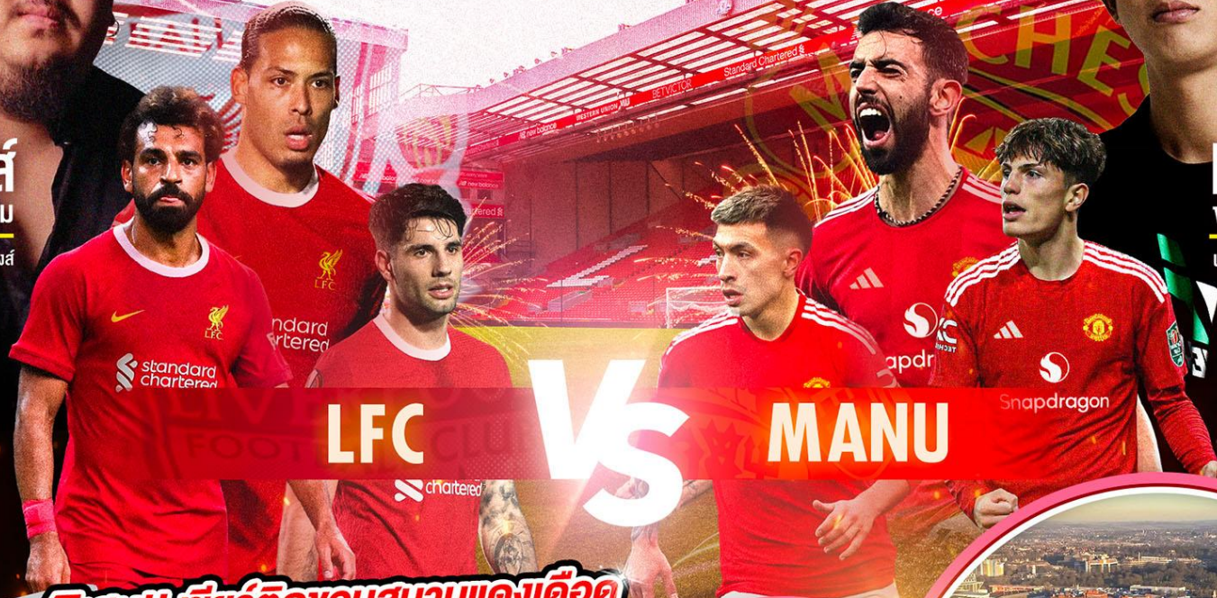
แบ ชอบสนาม นำทีมฝั่งคิงพาวเวอร์

พิเศษ!! เซียร์ติดชอบสนามแดงเดือด สนามแอนฟิลด์ เข้าชมสนามโอลด์แทรฟฟอร์ด และสนามคิงพาวเวอร์