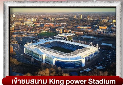
เข้าชมสนาม King power Stadium

พิเศษ!! เมนู เบอร์เกอร์ต้นตำรับ & กุ้งล็อบสเตอร์ และ เปิดย่างไฟร์ชิลีน