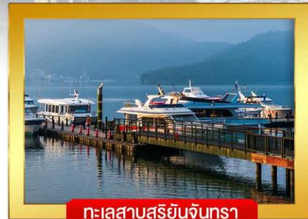
ทะเลสาบสุริยอันจันทร์