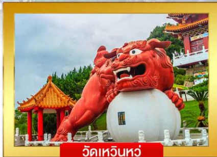
วัดเหวินหลู