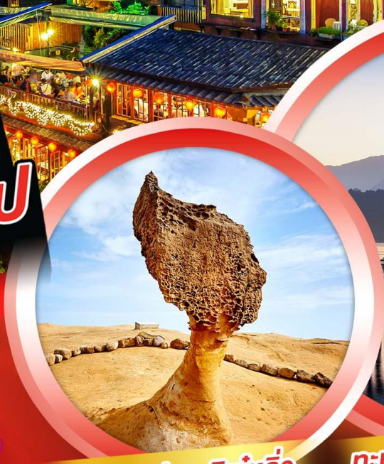
อุทยานแห่งชาติหยี่หลิว