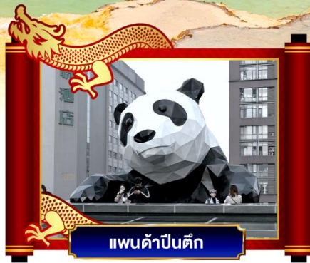
แพนด้าป็นตึก