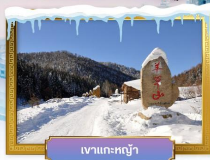
เขาแกะหยู๋