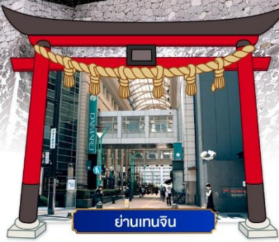
ย่านเกนจิน