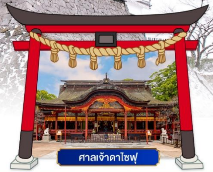
ศาลเจ้าดาโซฟู