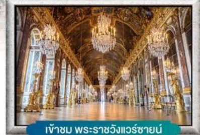
เข้าชม พระราชวังแวร์ซายน์