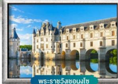
พระราชวังชองงโซ