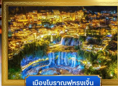
เมืองโบราณฟูหลงเจิ้น