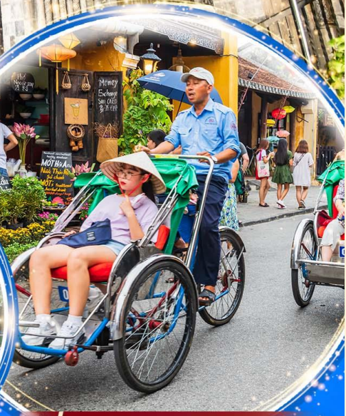
นั่งรถสามล้อซิโคล