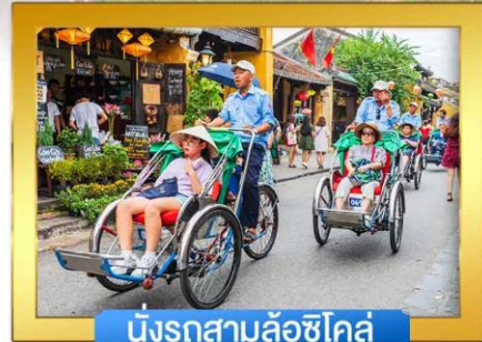
นั่งรถสามล้อซิโคล