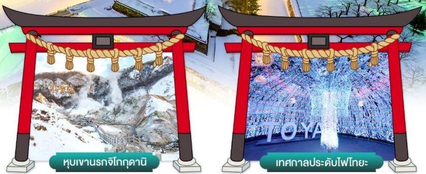
หุบเขานรกจิโกกุคานี