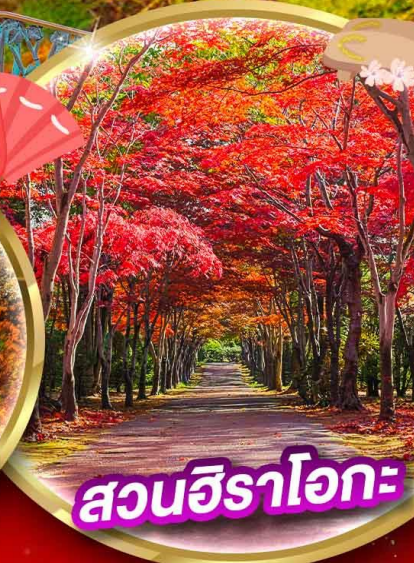
สวนชิราอิเกะ